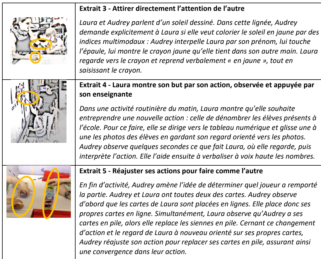
Figure 3. Différentes manières d'attirer l'attention de l'autre pour obtenir son attention conjointe et orienter conjointement leurs buts/coordonner l'action.

figure 3 illustre trois manières pour Audrey et Laura de combiner différents indices pour ajuster leur attention conjointe lors de différentes activités à table, que ce soit en tête à tête ou dans une activité de groupe. Plus spécifiquement, l'extrait 5 montre comment il est parfois nécessaire de réajuster les actions pour garantir que l'attention conjointe des deux participantes soit alignée sur les mêmes buts, permettant ainsi d'entreprendre une action partagée.