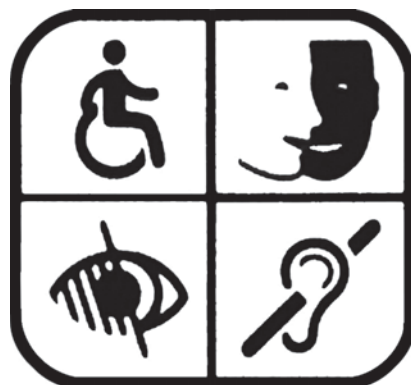
Figure 1. Panneau signalant des services pour personnes handicapées (gare de Lyon, Paris)

Les panneaux indiquant des services pour des personnes handicapées se basent ainsi sur des prototypes de situations de handicap tels que les personnes en fauteuil roulant, aveugles, sourdes ou déficientes intellectuelles. Ce constat rejoint celui fait par Harma, Gombert, Roussey, & Arciszewski (2012) sur une représentation du handicap essentiellement orientée sur la visibilité de celui-ci (voir Figure 1) :