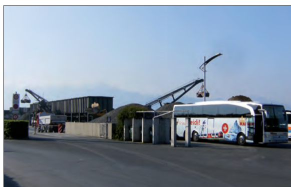
12. Un lieu répulsif où stationnent des bus touristiques (cliché : un enseignant en formation, mai 2008)

Les images produites en lien avec les thématiques proposées aux étudiants (10) se prêtent sans problème à ces réflexions. Ainsi, sans surprise, le secteur où se situent les ateliers d'entretien de la flotte de la CGN et le quai de la SAGRAVE figure systématiquement parmi les lieux considérés comme « répulsifs » et est représenté comme tel (fig. 5, 11 et 12). Même succincte, une analyse de la figure 11 au moyen de la typologie de Didier Mendibil (2001, 2008) met clairement en évidence le cadrage subjectivant qui contribue à l'effet escompté. Dans le même environnement, la présence d'un autocar touristique semble incongrue et le premier plan vide renforce le caractère pour le moins peu attractif du lieu (fig. 12). Le cadrage mixte (toujours