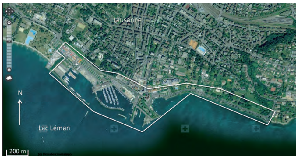
1. Le secteur étudié

Le secteur d'étude (fig. 1) se situe à l'interface de la ville de Lausanne et du lac Léman et se caractérise par des fonctions diversifiées. Cette situation et la diversité de ses fonctions constituent les premières raisons de ce choix ; il est également intéressant de confronter les étudiants à un espace que la plupart d'entre eux ont parcouru dans le cadre d'activités de loisirs, mais qu'ils n'ont en général pas analysé d'un point de vue géographique. Le périmètre sur lequel les étudiants sont invités à travailler dépasse sensiblement les limites de l'ancienne commune libre d'Ouchy, ce qui évite de restreindre le champ d'étude au secteur d'Ouchy qui peut être considéré comme un « haut lieu » lausannois et touristique. Enfin, la proximité de ce quartier et de la HEP est aussi un argument à l'appui du choix de ce terrain : une dizaine de minutes de marche suffisent pour l'atteindre à partir de la HEP (5).