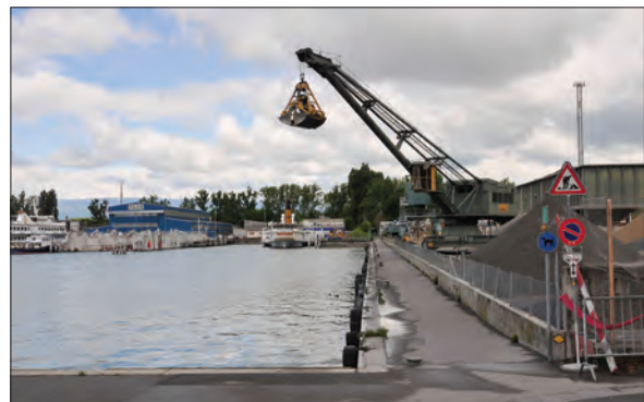
5. Image emblématique d'un lieu répulsif (ateliers de la CGN et quai de la SAGRAVE) (cliché : Ph. Hertig, mai 2012)