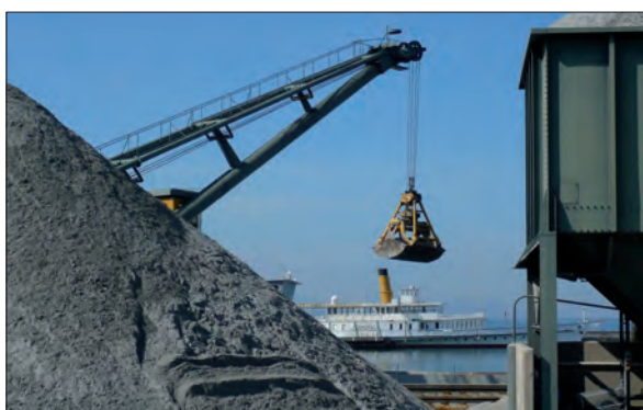
11. Lieux attractifs et lieux répulsifs, ou les visages contrastés d'Ouchy (cliché : un enseignant en formation, mai 2009)

Les images, en particulier les photographies, en raison de « leur fort contenu emblématique, sont [...] sujettes aux inerties et aux réminiscences mémorielles » (Mendibil, 2008), ce qui implique la nécessité de déchiffrer ces inerties, ces héritages, voire les stéréotypes que les images peuvent véhiculer — il s'agit là d'un enjeu didactique essentiel. En effet, l'une des finalités de l'enseignement de la géographie énoncée dans les curriculums actuels est de contribuer à ce que les élèves construisent leur rapport au monde. À ce titre, les élèves doivent notamment s'approprier des clés de déchiffrement des images au moyen desquelles sont représentées des parties du monde — un enjeu auquel il convient de sensibiliser les enseignants en formation. Ce volet de la démarche de formation y contribue en amenant les étudiants à mettre en question les choix qui sous-tendent la représentation photographique d'un espace donné. Plus largement, il permet aussi de rappeler (9) aux futurs enseignants que l'iconographie géographique alimente — avec d'autres vecteurs — le processus de formation de l'imaginaire individuel et collectif sur le monde et participe de ce fait des représentations sociales, ainsi que l'a fort bien montré Pascal Clerc (2002), par exemple.