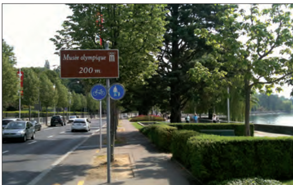
13. Tourisme, mobilité douce, espace piétonnier... et route de transit (cliché : Ph. Hertig, mai 2011)