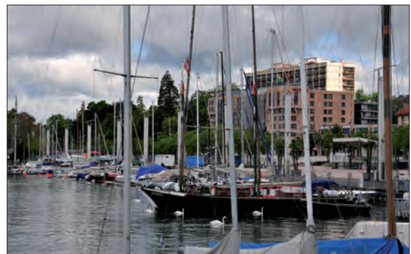
14. Port de plaisance d'Ouchy. À l'arrière-plan, hôtel (bâtiment ocre) et immeuble résidentiel (cliché : Ph. Hertig, mai 2012)