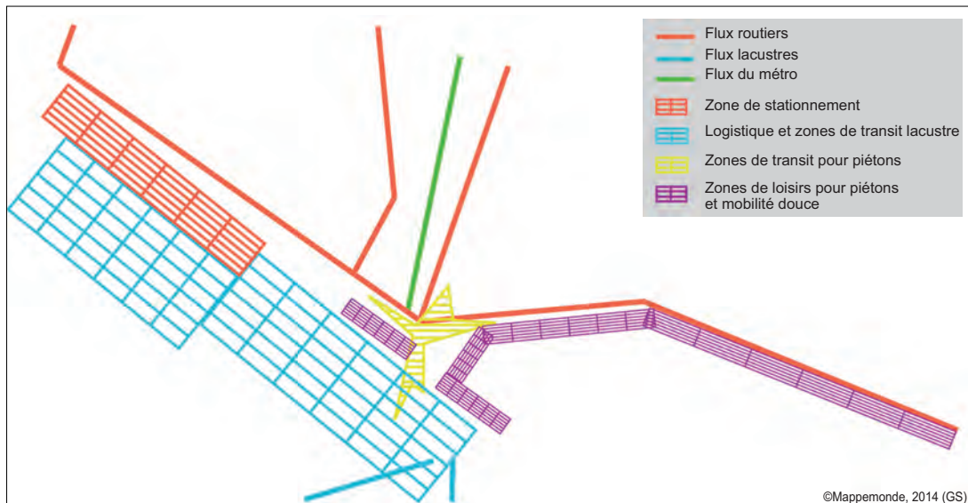
10. « Espaces de circulation et flux » réalisé par un groupe d'étudiants en mai 2011