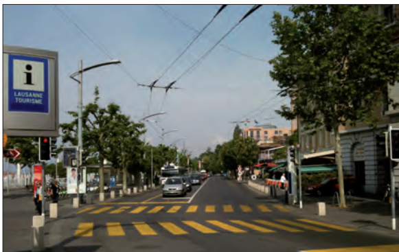
6. Image emblématique de l'axe de transit à Ouchy (mai 2011)