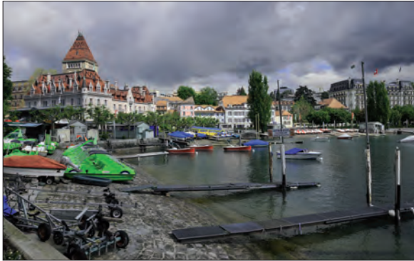
2. Image emblématique de la fonction touristique d'Ouchy (mai 2012)

jetée, qui abrite les ateliers d'entretien de la flotte de la CGN et un quai utilisé par une société exploitant les sables et graviers du Léman (fig. 5) ; cette dernière activité induit un trafic relativement important de poids lourds qui viennent charger ou décharger du sable ou des graviers de toutes tailles. Enfin, une part non négligeable de la surface de la zone étudiée est occupée par des voies de circulation, parmi lesquelles un axe de transit (fig. 6) souvent congestionné aux heures de pointe, ainsi que par des parkings en plein air (fig. 7).