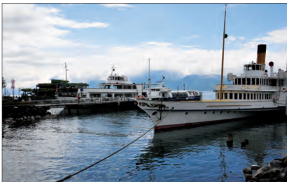
4. Le débarcadère de la CGN. Lieu attractif pour les touristes et lieu par où transitent les frontaliers (cliché : Ph. Hertig, mai 2012)