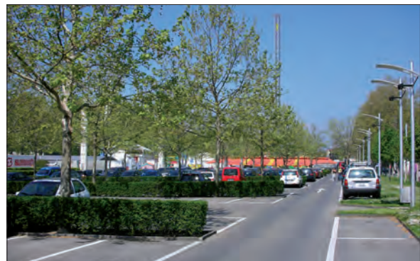
7. Zone de stationnement (parking P + R)