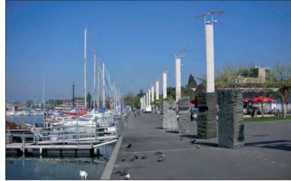
3. Promenade (espace piétonnier) longeant le port de plaisance (cliché : Ph. Hertig, mai 2008)